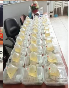
วันจันทร์ที่ ๑๖ กุมภาพันธ์ ๒๕๖๙ เวลา ๐๙.๐๐-๑๖.๓๐ ณ ห้องประชุมสำนักงานสาธารณสุขอำเภอสากเหล็ก จังหวัดพิจิตร